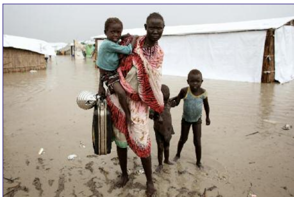
Soudan du sud 2014

L'augmentation de la fréquence et de l'intensité des catastrophes climatiques (sécheresse, tempêtes, inondations, fonte de glaces), modifie le cycle des saisons. L'UNISDR (Bureau des Nations unies pour la réduction des risques de catastrophes) fait état d'une récente étude portant sur 141 pays, qui a établi qu'un plus grand nombre de femmes que d'hommes mouraient à la suite d'aléas naturels et