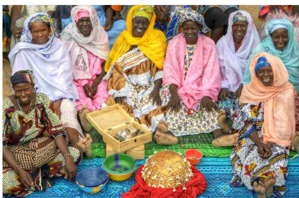
© Mali 2012 CARE CC et Autonomisation (Associations villageoises d'épargne et de crédit)

La méconnaissance de la contribution des femmes dans les politiques liées aux dérèglements climatiques a une double dimension. Premièrement, les femmes agissent et apportent une importante contribution au niveau local, échelle peu visible et moins valorisée. Deuxièmement, elles demeurent largement sous-représentées dans les instances de décision et d'élaboration des politiques publiques.