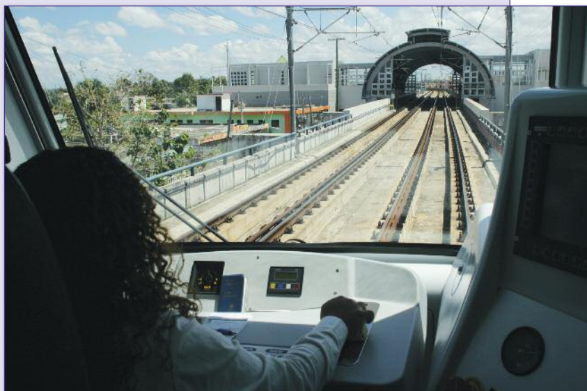
République dominicaine – développement d'une 2 e ligne de métro à Saint-Domingue, diversification des métiers et atténuation