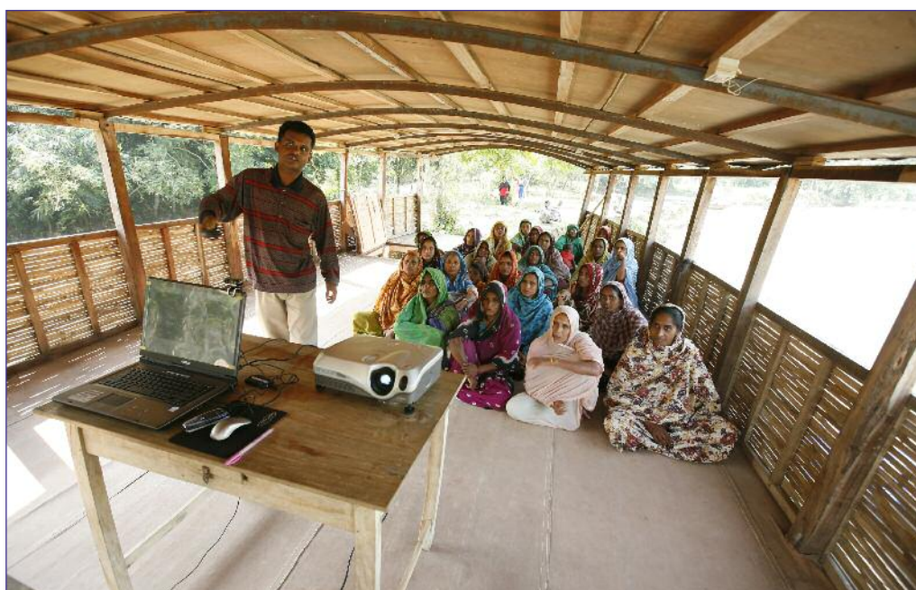
Bangladesh, formation de femmes adultes à bord d'une « école flottante », projet de l'ONG Shidhulai Swarnivar Sangstha pour permettre aux enfants de poursuivre leur scolarité pendant les inondations aggravées par le dérèglement climatique

L'on notera l'importance de l'allocation de budgets structurels pour la mise en œuvre opérationnelle du Plan de Lima sur le genre et ou développement de mécanismes de budgétisation sensible au genre pour les programmes de développement international, en lien avec la mise en œuvre des ODD, et notamment de l'Objectif 5 sur l'autonomisation des femmes.