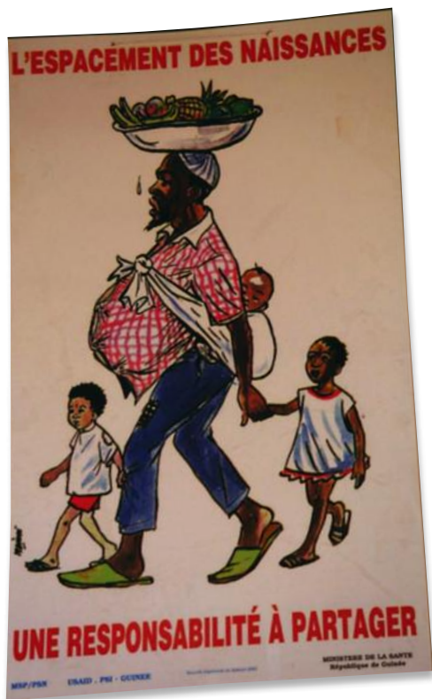
affiche du Ministère de la Santé de la République de Guinée.

à intervenir de manière concrète sur les questions climatiques. Or trop peu de femmes des pays en développement, surtout si elles sont pauvres, ont accès à la contraception moderne. Selon le rapport annuel du Fonds des Nations unies pour la population (UNFPA) sur l'État de la population mondiale 2012, les financements nécessaires pour assurer l'accès à un planning familial de qualité aux 867 millions de femmes en âge de procréer dans les pays en voie de développement sont loin d'être rassemblés. Selon le rapport, 222 millions d'entre elles ne bénéficient d'aucune politique de planification familiale.