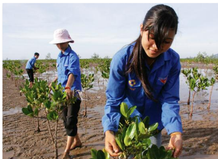
Vietnam - Réhabilitation des mangroves / écosystèmes côtiers (approche intégrée du genre, adaptation et atténuation)

Pour mettre en place une approche territoriale, il est nécessaire de croiser les analyses entre les inégalités géographiques, territoriales, économiques, sociales et le genre afin de proposer des solutions adaptées qui puissent engendrer des résultats au niveau communautaire. A cet effet, investir au niveau des collectivités locales représente un axe de travail pertinent.