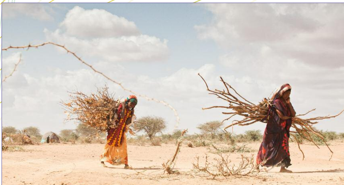
Réfugiées somaliennes au Kenya, ayant fui la guerre civile et la sécheresse