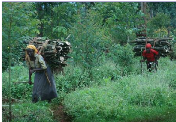
Mont Elgon, Ouganda - © Charles Akena/IRIN

La sécheresse, les inondations, l'érosion, la fonte des glaciers, la salinisation des eaux et l'élévation du niveau de la mer ont des impacts économiques directs, tels que la diminution des ressources halieutiques, la moindre fertilité des sols et la baisse des rendements des cultures et le manque d'eau propre et potable.